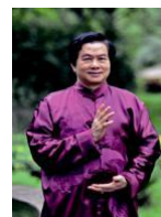
Grand Maître Mantak Chia, fondateur du Système UHT

Ce système sert à cultiver un corps sain, à former l'âme et à élever l'esprit. Ses branches et ses principales formules couvrent la méditation, le Qi Gong, les pratiques du Tao de l'amour ainsi que les arts martiaux et de la guérison. Il donne aux individus le pouvoir de développer leur potentiel physique, mental, émotionnel et spirituel, de devenir leur propre guérisseur et leur propre maître. L'UHTS est partagé sur les 6 continents par son fondateur, Grand Maître Mantak Chia, ainsi que par la Faculté UHT avec plus de 900 instructeurs et praticiens certifiés. Ses pratiques sont accessibles et conviennent au mode de vie occidental.