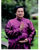
UHT System Founder Grandmaster Mantak Chia

Das praktische UHT System dient dazu, einen gesunden Körper zu pflegen, die Seele zu entwickeln und den Geist zu erhöhen. Hauptzweige und Kernformeln des UHTS beinhalten Meditation, Qi Gong, Übungen zur Heilenden Liebe sowie Kampfkunst und Chi Nei Tsang Massage. Beübt der Mensch die Techniken, befähigt es ihn, sein physisches, mentales, emotionales und spirituelles Potenzial harmonisch zu entwickeln, um sein eigener Heiler und Meister zu sein. Das ganzheitliche System wird auf 6 Kontinenten durch seinen Gründer Großmeister Mantak Chia und die UHT-Fakultät mit über 900 zertifizierten Lehrern unterrichtet. Durch seine gute Zugänglichkeit kommt das System und seine Techniken dem westlichen Lebensalltag sehr entgegen und erlaubt es jedem Menschen, aus eigener Entscheidung ein Leben voller Freude, Gesundheit, Liebe und Reichtum zu führen.